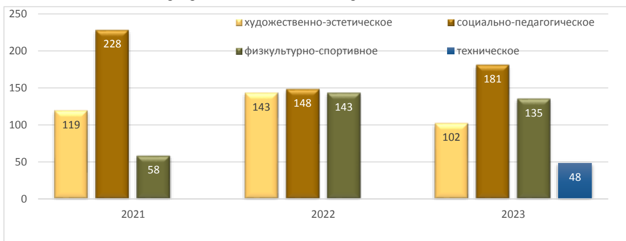
Охват воспитанников, обучающихся по дополнительным программам в динамике за три года:

Удельный вес численности воспитанников, обучающихся по дополнительным программам в 2023 году составил 87% от общей численности воспитанников ГБДОУ с учетом детей раннего возраста.